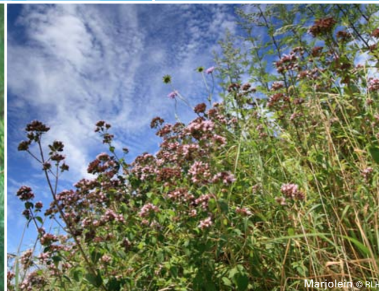
Marjolein © RLH